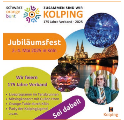
Text: Ewald Kommer; Bilder: Ewald Kommer & Barbara Flieger

Dein Platz bei Kolping. Die Aktion der Kolpingjugend nahm Diözesanpräsident Hasmüller auf und ermunterte die Kolpingsfamilien, mit dem Sinnbild des orangenen Stuhls die Einladung deutlich zu machen: Bei uns ist Platz für Dich!