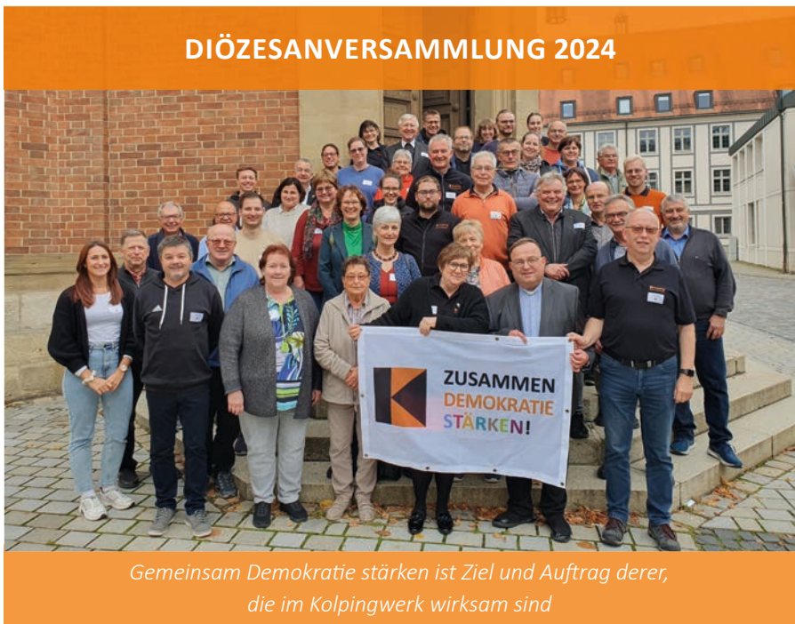
Gemeinsam Demokratie stärken ist Ziel und Auftrag derer, die im Kolpingwerk wirksam sind